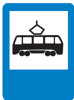
5.17. «Место остановки трамвая»