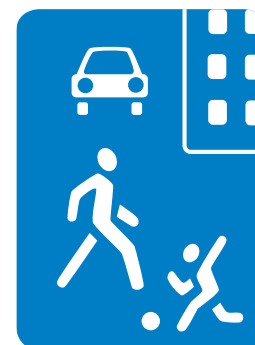
5.21. «Жилая зона»