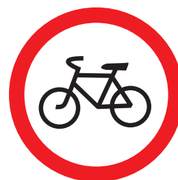
3.9. «Движение на велосипедах запрещено»