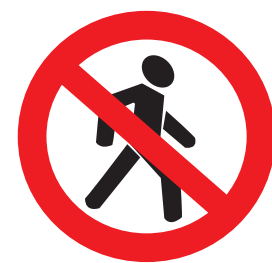
3.10. «Движение пешеходов запрещено»