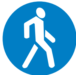
4.5.1. «Пешеходная дорожка»