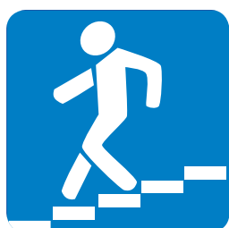
6.6. «Подземный пешеходный переход»