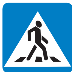
5.19.2 «Пешеходный переход»