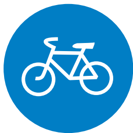
4.4.1. «Велосипедная дорожка»