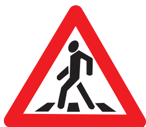
1.22 «Пешеходный переход»