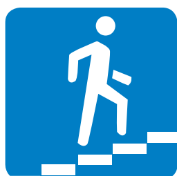
6.7. «Надземный пешеходный переход»