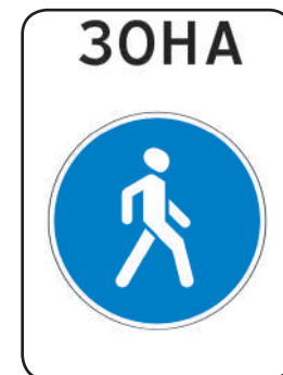
5.33 «Пешеходная зона»