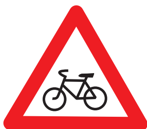
1.24. «Пересечение с велосипедной или велопешеходной дорожкой»